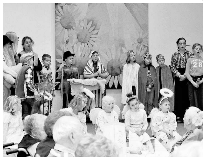
Michaelisheim: Die Kindergottesdienstgruppe der Liebfrauenkirchengemeinde zeigt ein Krippenspiel.

ben der Förderung öffentlicher Vorhaben (die sich auf bis zu drei Viertel der Kosten belaufen kann) auch private Erneuerungsprojekte mit 30 Prozent (und maximal 150.000 Euro bei einer Umnutzung von Gebäuden) gefördert würden. jr